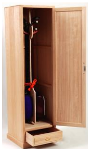
二丁入れ 回転タンス (総桐) (長唄～津軽 兼用)