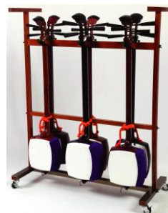
三味線 スタンド 6丁掛