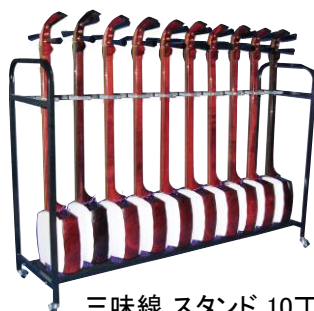
三味線 スタンド 10丁掛